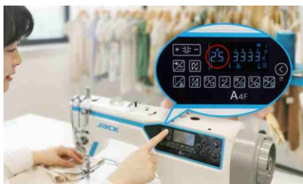
Precyzyjna regulacja długości ściegu.

Centralne smarowanie (tradycyjna miska olejowa).