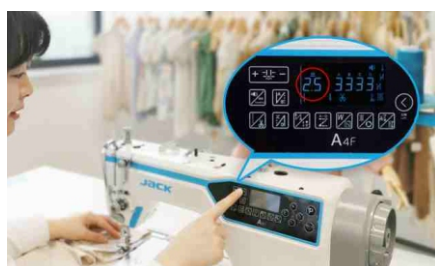
Precyzyjna regulacja długości ściegu

Zastosowanie silników krokowych, sterujących podnoszeniem stopki, ustawieniem długości ściegu i odpowiadających za funkcję ryglowania znacznie redukuje poziom hałasu podczas ryglowania, a także pozwala precyzyjnie ustawić długość ściegu z dokładnością 0,1 mm. Centralne smarowanie (tradycyjna miska olejowa).