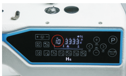
Precyzyjna regulacja długości ściegu

Zastosowanie silników krokowych, sterujących ustawieniem długości ściegu i odpowiadających za funkcję ryglowania znacznie redukuje poziom hałasu podczas ryglowania, a także pozwala precyzyjnie ustawić długość ściegu z dokładnością 0,1 mm. Centralne smarowanie (tradycyjna miska olejowa).