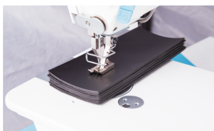
Idealna do szycia materiałów tapicerskich